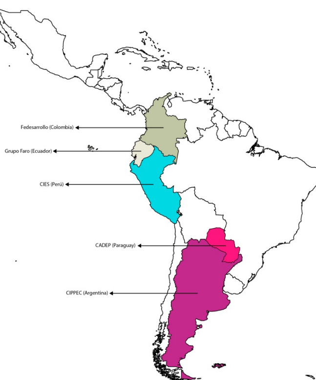
Mapa 1: Experiencias nacionales que cubre este estudio